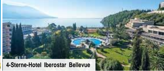
4-Sterne-Hotel Iberostar Bellevue