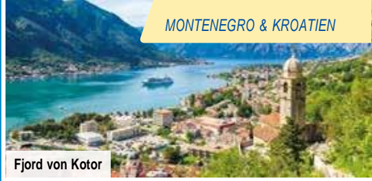
Fjord von Kotor

8-tägige Flugreise mit magischen Entdeckungen & Traumstränden an der Adria