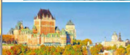
Château Frontenac, Québec City