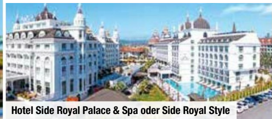
Hotel Side Royal Palace & Spa oder Side Royal Style