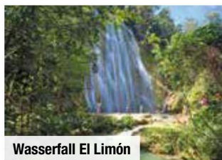
Wasserfall El Limón

Tag 4: Eine leichte Wanderung bringt Sie zum 40 m hohen Wasserfall Salto de Jimenoa . Anschließend erleben Sie in der Kaffeefabrik Monte Alto eine Führung und Verkostung. Weiterfahrt nach Santiago und Stadtrundgang.