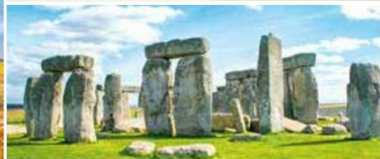
Stonehenge inklusive Eintritt