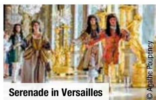
Serenade in Versailles

Paris: Hier duftet es nach köstlichen Backwaren, hier ragt der Eiffelturm in den blauen Himmel und hier herrscht der Glanz längst (noch nicht) vergangener Zeiten! Die Seine ist ein Sehnsuchtsort Romantikliebender und in Montmartre fühlen auch Sie sich wie ein junger Pablo Picasso. Höhepunkt ist Ihre Teilnahme an der Serenade in Versailles. Zwei Ganztagesausflüge und die Halbpension sind bereits inkludiert. Verlieben Sie sich in Paris!