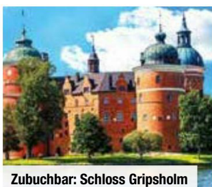
Zubuchbar: Schloss Gripsholm

Alle verfügbaren Reiseternine & Flughäfen finden Sie auf trendtours.de