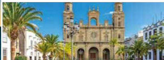
Kathedrale Santa Ana in Las Palmas