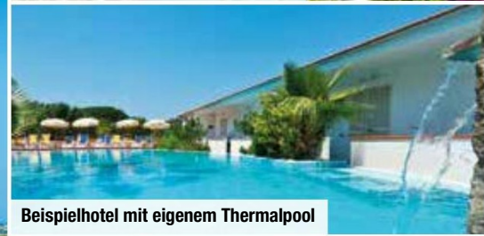
Beispielhotel mit eigenem Thermalpool