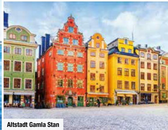
Altstadt Gamla Stan

Zwischen dem Mälarsee und dem faszinierenden Schärengarten der Ostsee liegt Stockholm, auf 14 Inseln erbaut. Auf diesem Städte-Erlebnis staunen Sie über Stockholms Altstadt mit dem Rathaus, in dem die Nobelpreise verliehen werden, und über Schloss Drottningholm, Wohnsitz der schwedischen Königsfamilie sowie UNESCO-Weltkulturerbe. Sie nächtigen komfortabel im Hotel in Stockholm. Finden Sie Ihr Reiseglück in Europas schönster nordischer Städteperle!