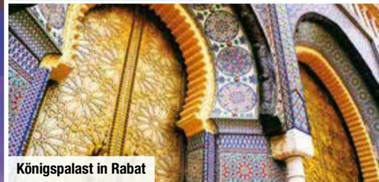
Königspalast in Rabat