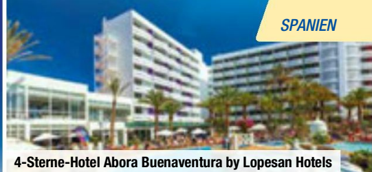
4-Sterne-Hotel Abora Buenaventura by Lopesan Hotels