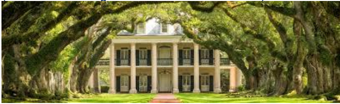
Einmalig schön: Houmas House Plantation & Gardens

Favorit: „Houmas House Plantation & Gardens“– hier machen wir eine Pause zur fakultativen Besichtigung (Eintritt & Führung ca. 30US$ vor Ort zahlbar)