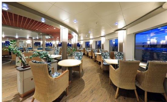
Der „neue“ Palmgarten der MS Hamburg

Wir haben Ihnen eine Menükarte aus Grönland von der MS Hamburg mitgebracht: