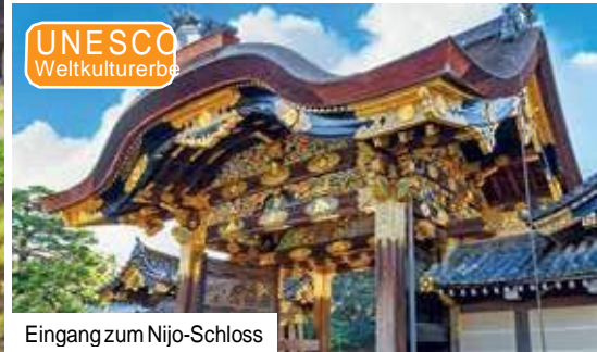
Eingang zum Nijo-Schloss