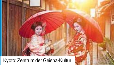
Kyoto: Zentrum der Geisha-Kultur