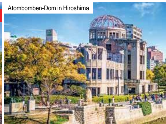
Atombomben-Dom in Hiroshima