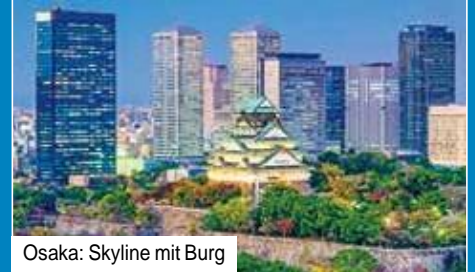
Osaka: Skyline mit Burg