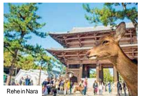
Rehe in Nara

Mittags Bustransfer zur Flughafeninsel Kansai und Flug nach Deutschland. „Sayonara“, bis bald bei trendtours!