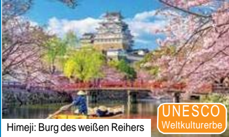
Himeji: Burg des weißen Reihers