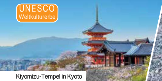
Kiyomizu-Tempel in Kyoto