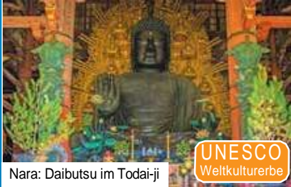
Nara: Daibutsu im Todai-ji