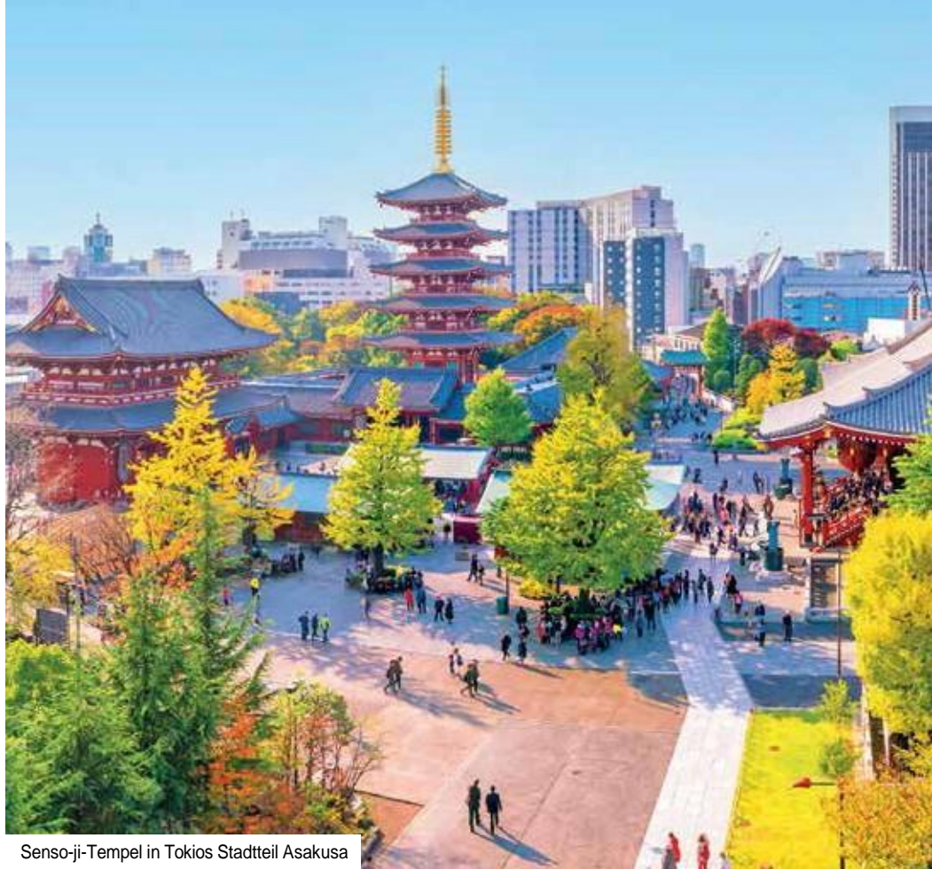
Senso-ji-Tempel in Tokios Stadtteil Asakusa