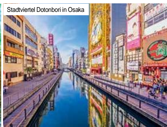
Stadtviertel Dotonbori in Osaka