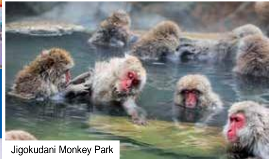
Jigokudani Monkey Park

UNESCO-Weltkulturerbe Japans bestaunen: Lassen Sie sich in den Bann des 3.776m hohen Fuji-san ziehen. Das bekannteste Wahrzeichen Japans gilt als heiliger Ort und dient als künstlerische Inspiration.