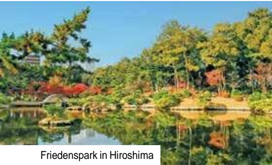
Friedenspark in Hiroshima