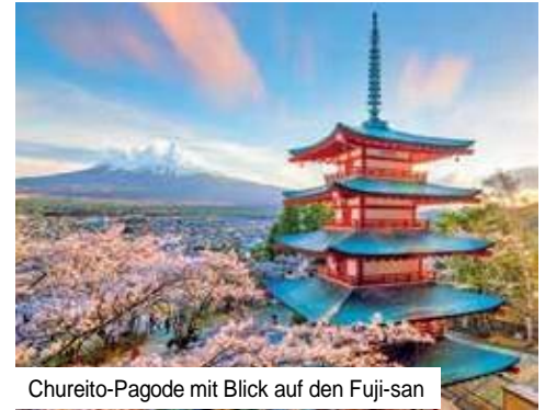
Chureito-Pagode mit Blick auf den Fuji-san

Ganztagesausflug „Historisches Kamakura & Fuji-Hakone-Izu-Nationalpark“ Erleben Sie Kamakura und den Fuji-Hakone-Izu-Nationalpark (UNESCO) mit Bootsfahrt sowie Panoramablick auf den Fuji-san nahe der Chureito-Pagoda Nur Vorabbuchung € 219 p. P.