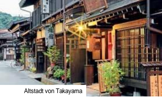
Altstadt von Takayama