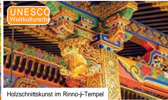
Holzschnittkunst im Rinnō-ji-Tempel