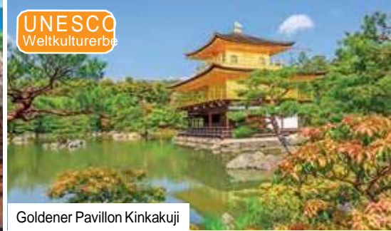
Goldener Pavillon Kinkakuji