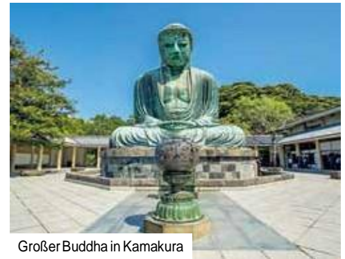
Großer Buddha in Kamakura

Einreisebestimmungen: Für diese Reise benötigen Deutsche, Schweizer sowie alle EU-Staatsbürger einen Reisepass, der noch mindestens bis zum Ende des geplanten Aufenthalts gültig ist. (Stand: November 2023)