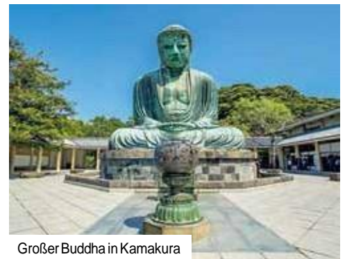
Großer Buddha in Kamakura

Einreisebestimmungen: Für diese Reise benötigen Deutsche, Schweizer sowie alle EU-Staatsbürger einen Reisepass, der noch mindestens bis zum Ende des geplanten Aufenthalts gültig ist. (Stand: November 2023)