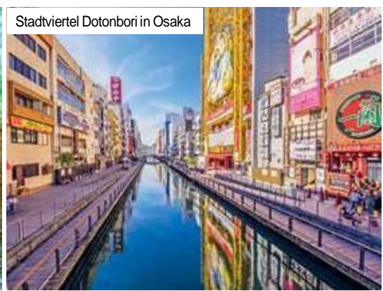
Stadtviertel Dotonbori in Osaka