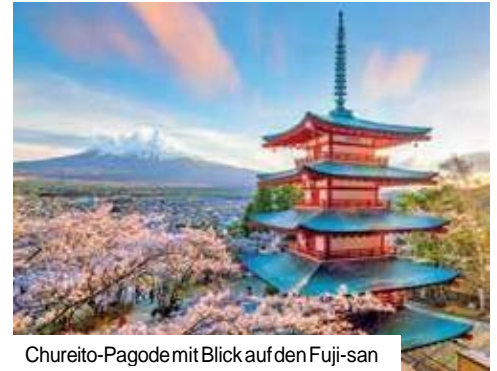
Chureito-Pagode mit Blick auf den Fuji-san

Ganztagesausflug „Historisches Kamakura & Fuji-Hakone-Izu-Nationalpark“ Erleben Sie Kamakura und den Fuji-Hakone-Izu-Nationalpark (UNESCO) mit Bootsfahrt sowie Panoramablick auf den Fuji-san nahe der Chureito-Pagoda Nur Vorabbuchung € 219 p. P.