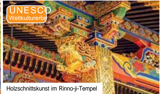
Holzschnittkunst im Rinno-ji-Tempel