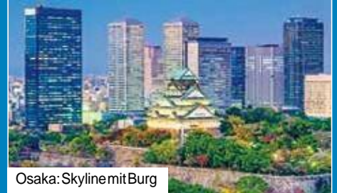
Osaka: Skyline mit Burg