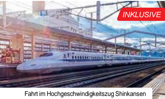
Fahrt im Hochgeschwindigkeitszug Shinkansen