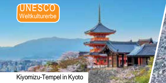
Kiyomizu-Tempel in Kyoto