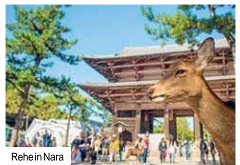
Rehe in Nara

Mittags Bustransfer zur Flughafeninsel Kansai und Flug nach Deutschland. „Sayonara“, bis bald bei trendtours !