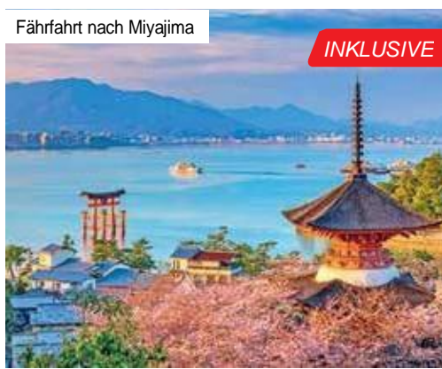
Fährfahrt nach Miyajima

Auch das Nijo-Schloss, das über ein Schutzsystem mit doppelten Burggräben verfügt, fasziniert mit seiner Architektur und wunderschön gestaltetem Garten. Abschließend genießen Sie vom Kiyomizu-Tempel den Panoramablick über die Stadt. Kulinarische Genüsse fi sich auf der berühmten Marktstraße Nishiki-dori, die Sie heute auch