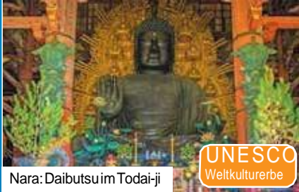
Nara: Daibutsu im Todai-ji