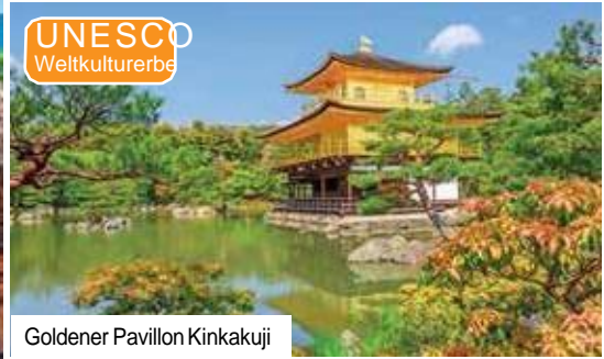
Goldener Pavillon Kinkakuji