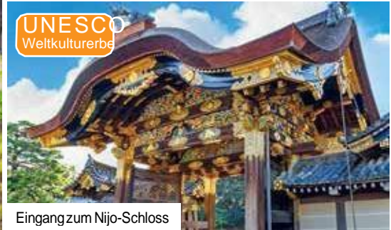
Eingang zum Nijo-Schloss