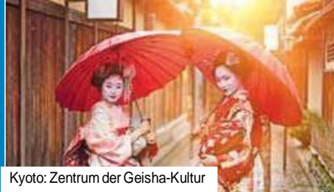
Kyoto: Zentrum der Geisha-Kultur