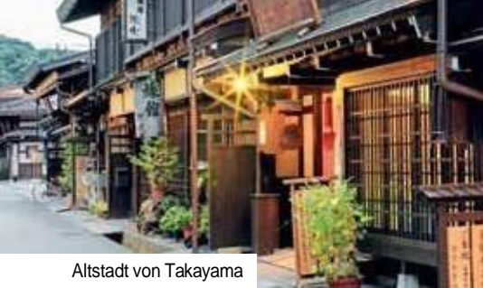
Altstadt von Takayama