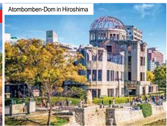
Atombomben-Dom in Hiroshima