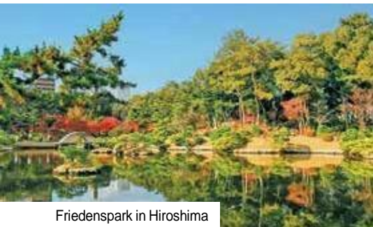
Friedenspark in Hiroshima