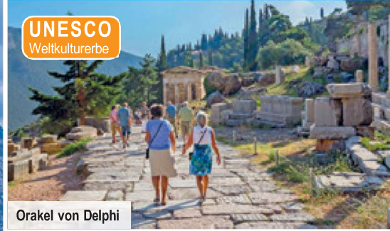
Orakel von Delphi