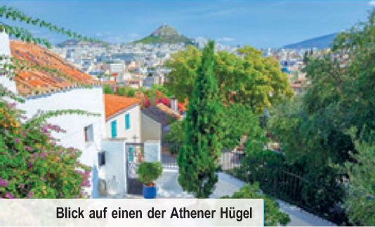
Blick auf einen der Athener Hügel