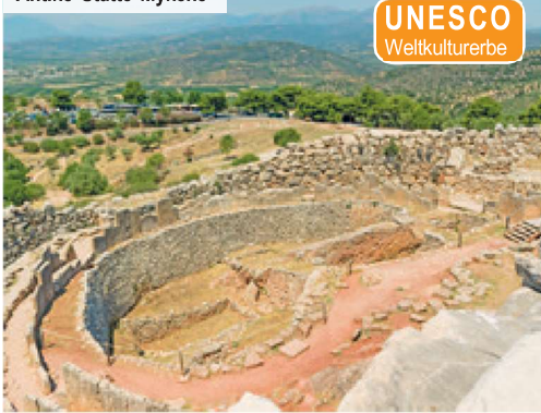
Antike Stätte Mykene