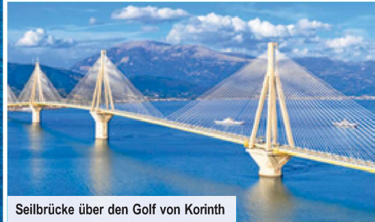
Seilbrücke über den Golf von Korinth

Sieben Weltwunder der Antike, die leider verschollen ist, erschuf. Lassen Sie diesen eindrucksvollen Ort auf sich wirken, bis Sie an der Westküste der Peloponnes Richtung Norden und hinter Patras über die imposante Seilbrücke, die den Golf von Korinth auf 2,5 km Länge überspannt, zurück aufs Festland fahren. Hier besuchen Sie ein Weingut und probieren köstlichen griechischen Wein, das „Blut der Erde“. Nach der Verkostung solch edler Tropfen werden Sie Udo Jürgens sicher noch besser verstehen können.