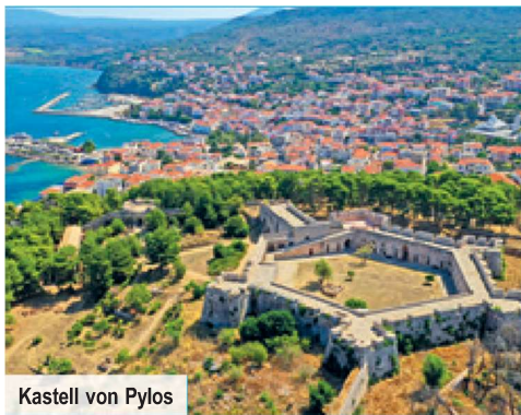
Kastell von Pylos