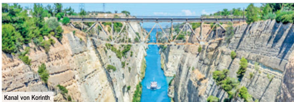
Kanal von Korinth

die Reste der zyklischen Ringmauer, die Schatzkammer des Atreus und das Löwentor: Der Eingang in die Stadt besteht aus massiven Monolithen und wird von zwei Löwen aus Stein bewacht. Beim Spaziergang durch die Hafenstadt Nafplio mit ihrem venezianischen Flair entdecken Sie einen Meilenstein der Geschichte Griechenlands: In der Vouleftiko-Moschee tagte das erste griechische Parlament nach der osmanischen Herrschaft! Nach Jahrhunderten der Monarchie fand hier Griechenland wieder zur Demokratie zurück. Ihr Besuch der Festung Palamidi bietet Ihnen spektakuläre Aussichten.