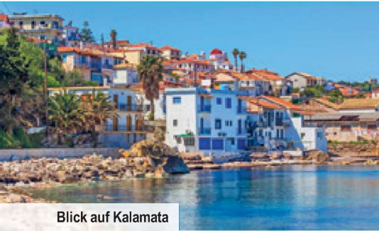
Blick auf Kalamata