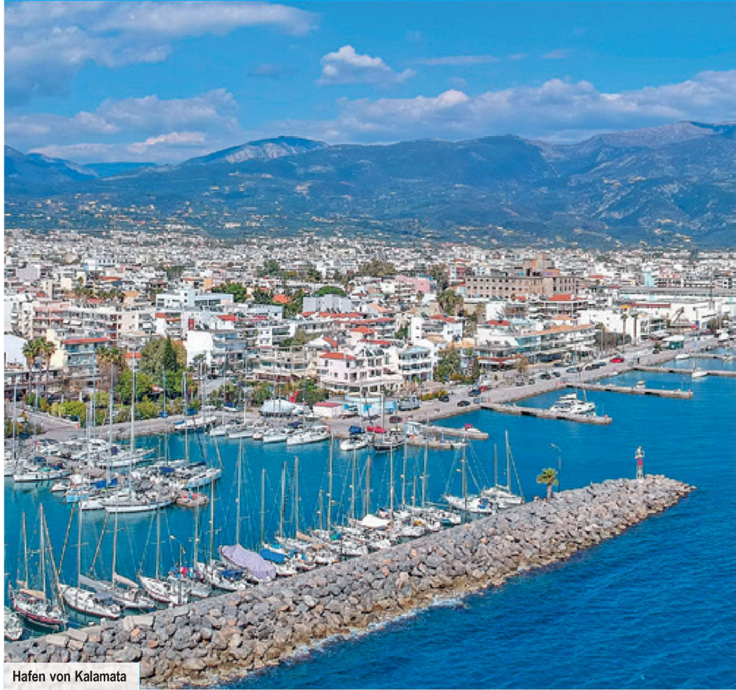
Hafen von Kalamata