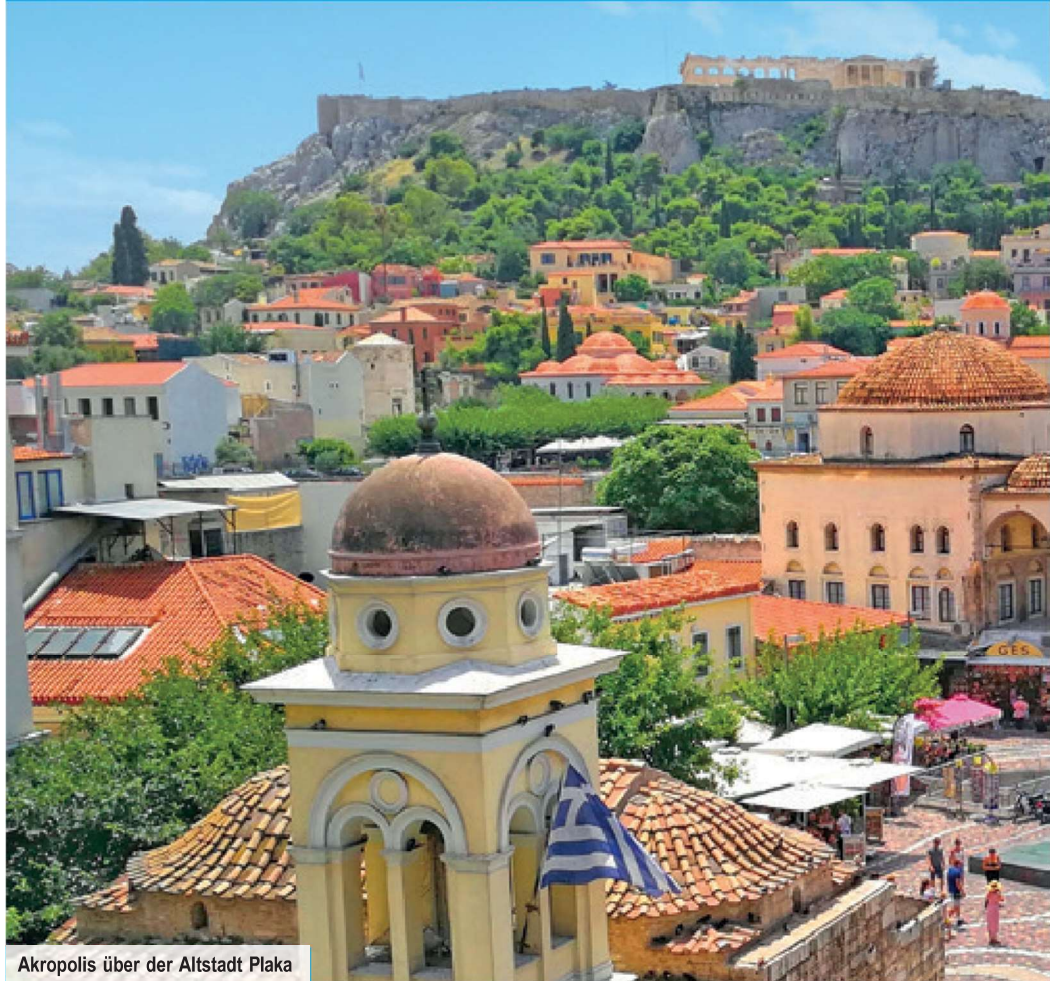
Akropolis über der Altstadt Plaka