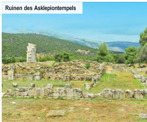
Ruinen des Asklepiotempels