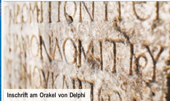
Inschrift am Orakel von Delphi