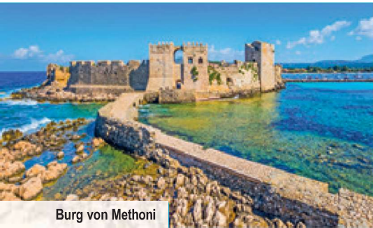
Burg von Methoni