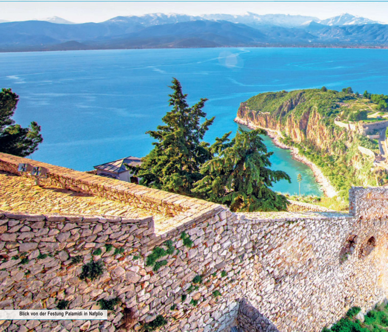
Blick von der Festung Palamidi in Nafplio

Auf dieser Rundreise erkunden Sie all diese Orte, wobei Sie bequem in 4-Sterne-Hotels residieren. Die Halbpension ist günstig zubuchbar! Ihr umfangreiches Rundreiseprogramm beinhaltet wirklich viele Höhepunkte: Sie verkosten griechischen Wein und erleben Athen auf einer Stadtbesichtigung, erkunden Epidauros mit dem Heiligtum des Asklepios, sehen die Ruinenstadt Mystras und das byzantinische Kloster Hosios Lukas. Freuen Sie sich auf die paradiesische Insel des Pelops und staunen Sie über die antiken Griechen, deren Kultur Ihnen auf dieser Rundreise so nah und vertraut erscheint.