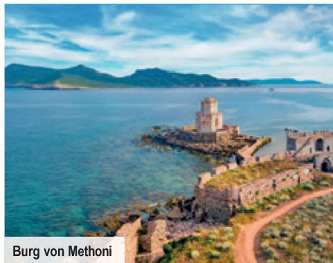
Burg von Methoni

nur mit zeitlich befristetem Aktions-Code