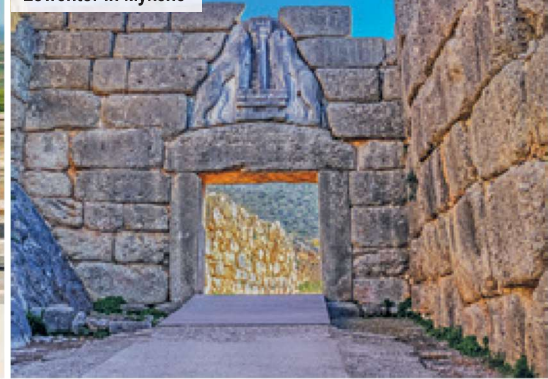
Löwentor in Mykene