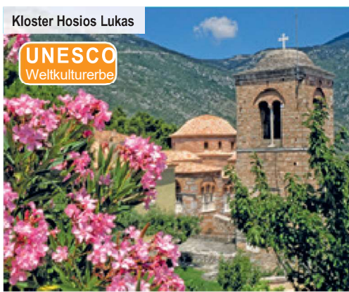
Kloster Hosios Lukas