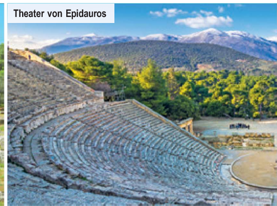
Theater von Epidauros