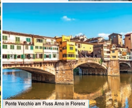
Ponte Vecchio am Fluss Arno in Florenz