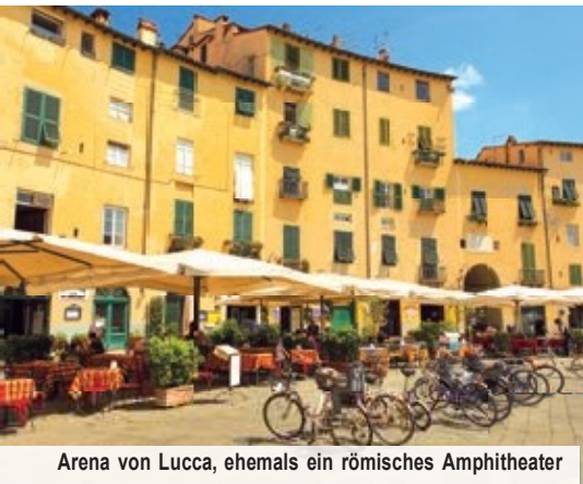
Arena von Lucca, ehemals ein römisches Amphitheater