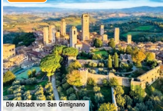
Die Altstadt von San Gimignano