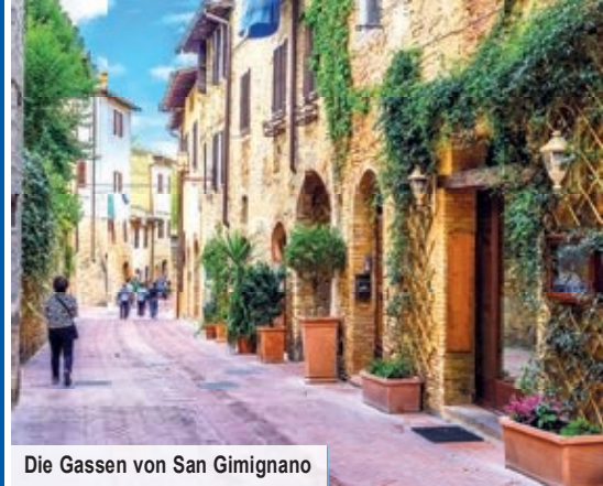
Die Gassen von San Gimignano