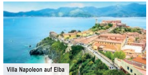
Villa Napoleon auf Elba