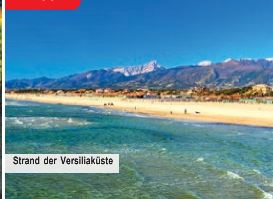
Strand der Versiliaküste