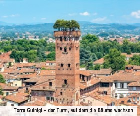
Torre Guinigi – der Turm, auf dem die Bäume wachsen