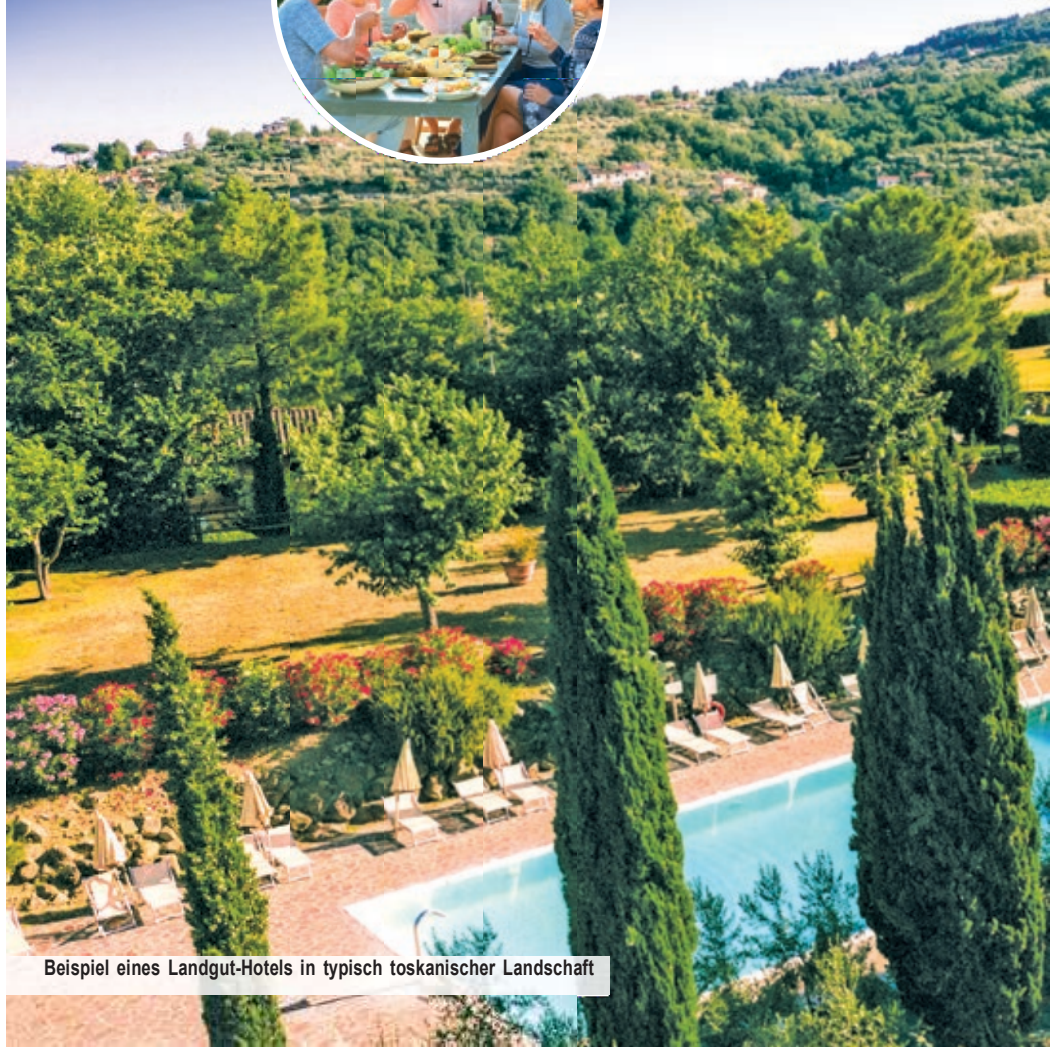
Beispiel eines Landgut-Hotels in typisch toskanischer Landschaft