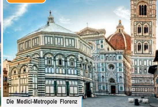
Die Medici-Metropole Florenz