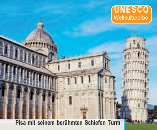
Pisa mit seinem berühmten Schiefen Turm